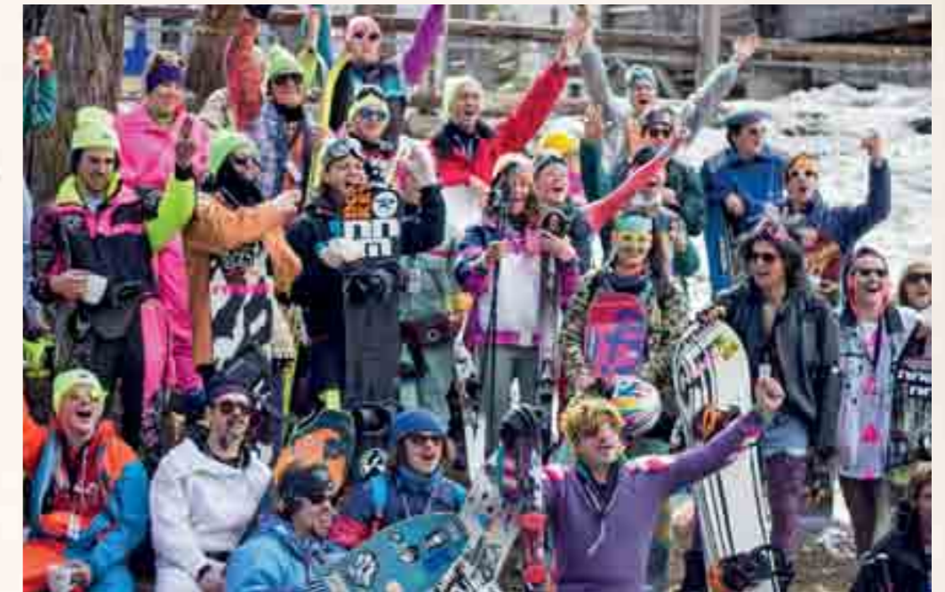
Nein, das ist keine Aufnahme aus den Achtzigern, sondern ein Schnappschuss vom «Totally Rad Day» vom letzten Jahr.

Wer bei diesem Event auf Punktejagd ist oder auf Zeitlimite fährt, ist definitiv am