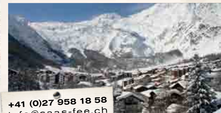
Foto-Postenlauf / Foto-Ralley

+41 (0)27 958 18 58 info@saas-fee.ch www.saas-fee.ch