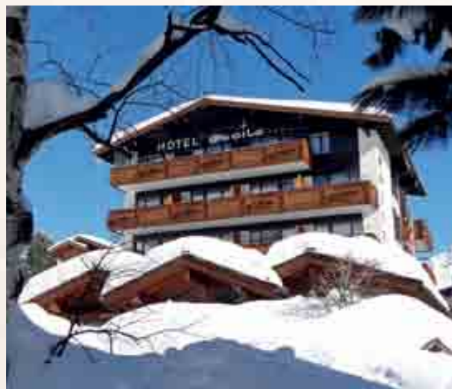
Wo aus Feriengästen Stammgäste werden: das Erlebnishotel Etoile in Saas-Fee.