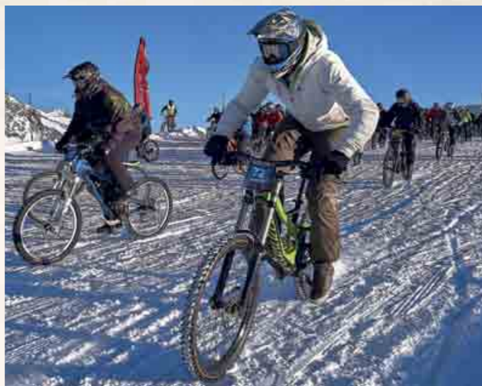
Über Eis und Schnee vom Mittelallalin nach Saas-Fee: Der Glacier-Bike-Downhill ist ein Rennen der Superlative und nur Könnern vorbehalten.