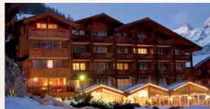
Feste Grösse bei den besten Winterhotels mit 4 Sternen ist der Schweizerhof Gourmet & Spa, der sich auf dem 19. Platz befindet.

24. Platz: Panoramahotel Alphubel, Saas-Fee