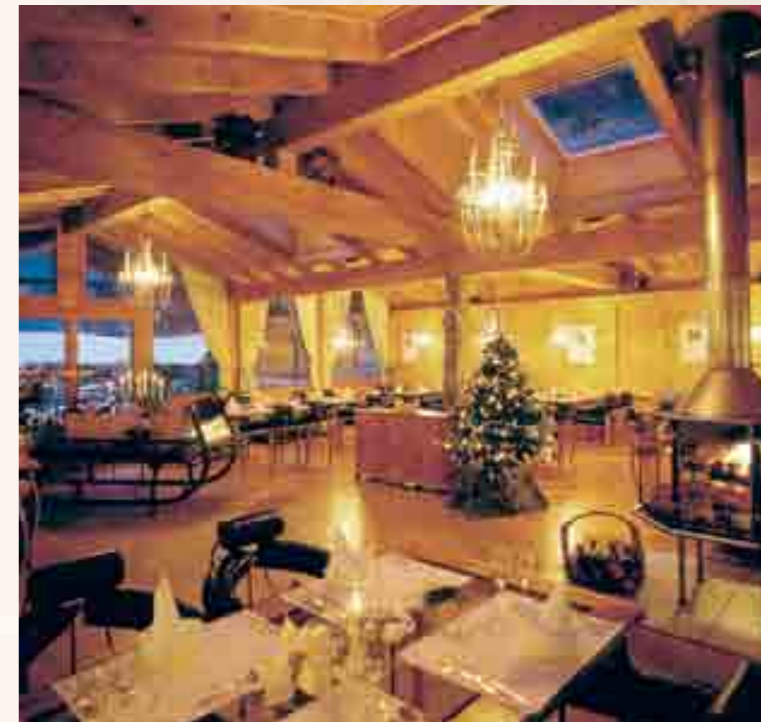
Das Wellness & Spa Pirmin Zurbriggen in Saas-Almagell klassiert sich auf dem 3. Platz bei den besten Winterhotels mit 4 Sternen. Auf dem Bild der von Künstler Heinz Julen konzipierte Speisesaal.