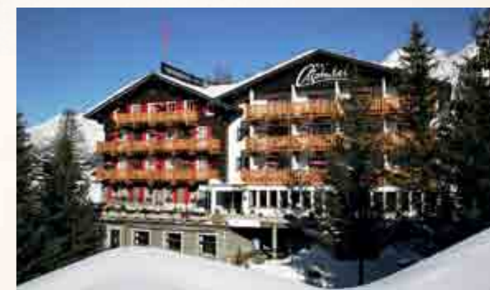
Das Panoramahotel Alphubel in Saas-Fee behauptet sich bei den besten Winterhotels mit 3 Sternen auf dem 24. Platz.