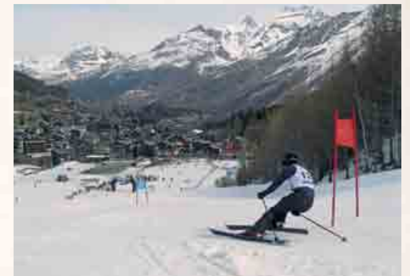
Nach 2011 heisst Saas-Fee wieder zum beliebten Talrennen willkommen.

Bei ungewissen Wetterverhältnissen informiert die Tel. Nr. 1600 (Regio Info)