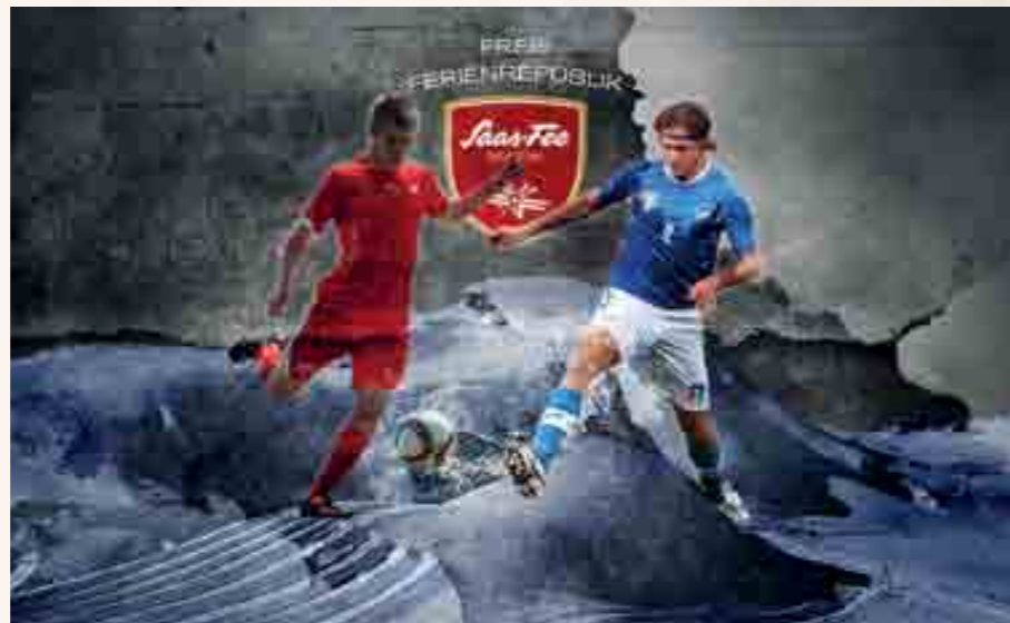
Fussball-Training auf höchstem Niveau: Am 12. März 2016 spielt die Schweiz gegen Italien auf 3500 m ü. M.

Das Mittelallalin auf 3500 m ü. M., von wo am 12. März 2016 um 8.00 Uhr zudem der Start des Glacier-Bike-Downhills erfolgt, trumpft gleich mehrmals mit Superlativen auf: Mit der höchstgelegenen Metro erreicht der Gast das höchstgelegene Drehrestaurant