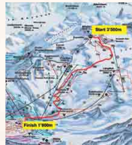
Die Herausforderung: Der Glacier-Bike-Downhill führt von der Gletscherwelt auf 3500 m ü. M. ins Gletscherdorf auf 1800 m ü. M.

Bodenhaftung und somit ein sehr schnelles Rennen. Die Spitzengeschwindigkeiten lagen bei rund 130 Kilometer pro Stunde. Dementsprechend gestaltete sich das Rennen überaus spannend. Bei den Herren lag bis kurz vor Schluss Vorjahressieger Philipp Bont in Füh-