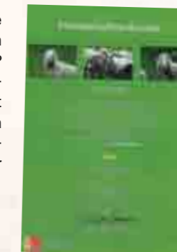
Die Patenschaftsurkunde von Roland Bieri.

Weitere Infos erhalten Sie bei: ProSpecieRara, 4052 Basel Telefon 061 545 99 11 www.prospecierara.ch