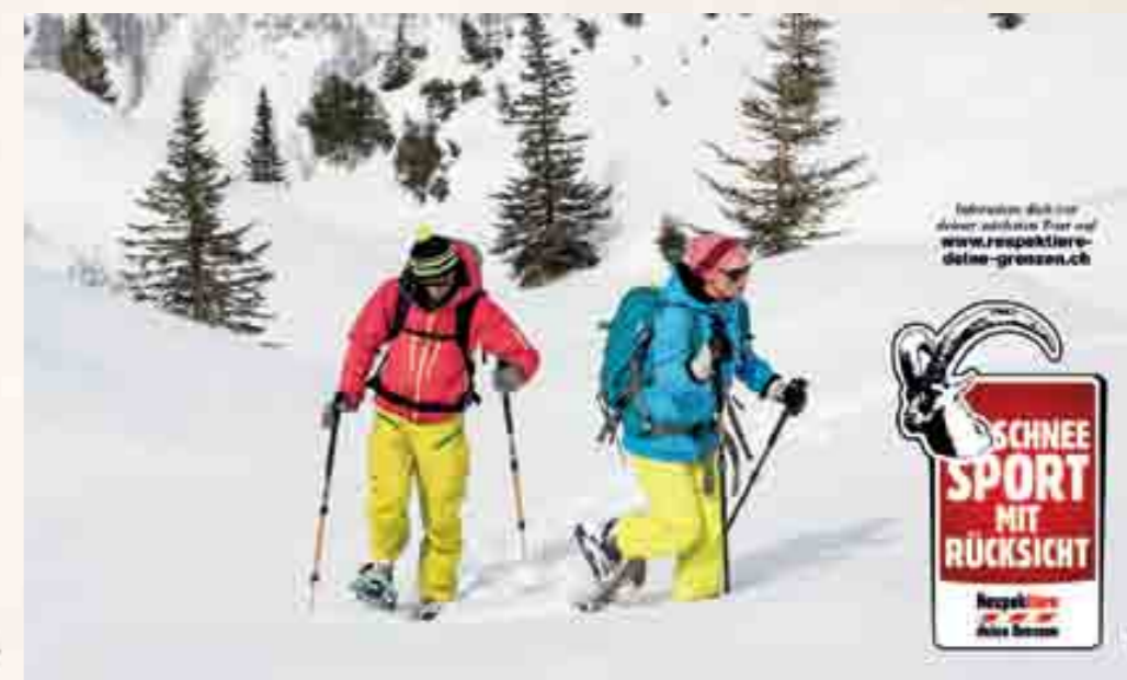
Die Natur gibt dem Menschen unendlich viel – bei Freizeitaktivitäten sollte ihr deshalb auch der nötige Respekt gezollt werden.

Das Schneeschuhwandern wie auch das Freeriding haben in den vergangenen Jahren einen starken Aufschwung erlebt. Das Skitourenfahren entwickelt sich in Richtung Breitensport. Für Tiere und Pflanzen bedeutet diese Entwicklung eine zunehmende Gefährdung, besonders die winterlichen Lebensräume von Raufusshühnern und Huftieren sind davon betroffen. Damit sich Schneesportlerinnen und Schneesportler naturverträglich verhalten und die Natur weiterhin in vollen Zügen und ohne Konflikte geniessen können, führen das Bundesamt für Umwelt BAFU und der Schweizer Alpen-Club SAC die Kampagne «Respektiere deine Grenzen – Schneesport mit Rücksicht» durch. Die Kampagne sensibilisiert für die Belange von Wildtieren und deren Lebensräumen, damit die untenstehenden Verhaltensregeln nachvollziehbar werden.