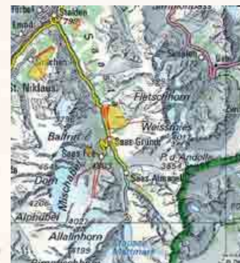
Blick auf das Saastal. Es wird empfohlen, die gelb markierten Gebiete zu meiden.

Legende Wildruhezonen und Wildschutzgebiete roter Balken: nicht betreten gelber Balken: empfohlen rote Linie: erlaubte Wege & Routen rote Linie: Skiliftaufbahn