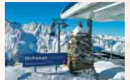
Bellebt: das sonnige Skigebiet Kreuzboden-Hohsaas.