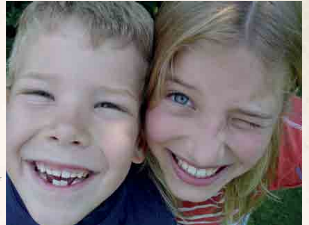
Menschen, welche sich eine heitere und lebenswürdige Art bewahren, können oftmals mehr von Gottes Botschaft erfahrbar machen als solche, welche zu ernsthaft durch die Welt gehen.

Heiter und lebenswürdig sein, heisst Menschen zum Lachen zu bringen, aber ohne bei jedem Gelächter dabei zu sein. Denn manche Formen des Grinsens, Brüllens und Grölens haben nichts mit Heiterkeit und Lebenswürdigkeit zu tun. Die Eltern einer heiteren und lebenswürdigen Art heissen: Hoffnung und Realismus. Die Mutter, die hintergründige