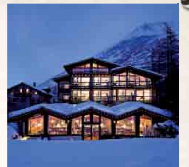
Funkelnder Stern am Schweizer Hotelthimmel: Das Wellness & Spa Pirmin Zurbriggen in Saas-Almagell.