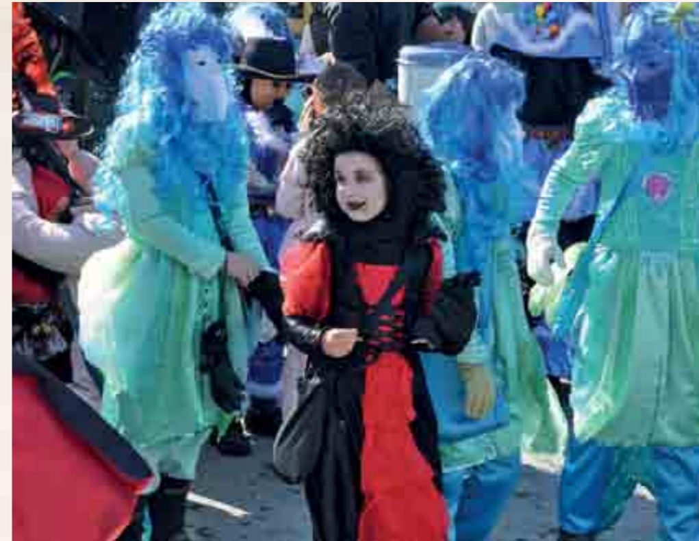
Alltag ade, jetzt hat die Fasnacht das Sagen.