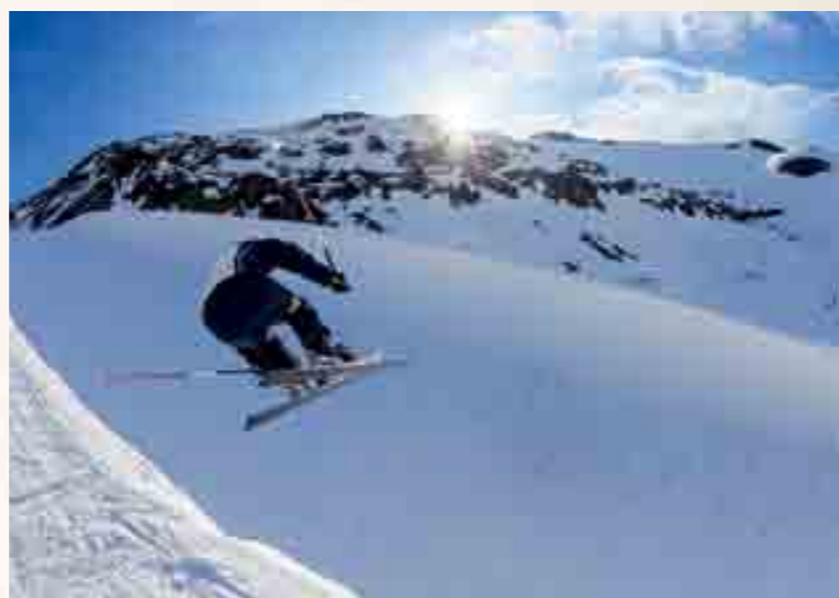
Beim Adrenalin-Cup gilt es verschiedene Challenges zu meistern wie hier das Mix Race & Flug.

Die Kategorie für wahre Allrounder. Neben den Disziplinen Alpin und Endorphin sind Ausdauer abseits der Piste beim Winterwan-