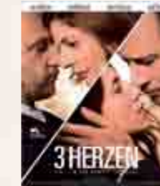
Mit der Deutschschweizer Premiere von «3 Herzen» wird das 2. Saas-Fee Filmfest eröffnet.

Vom 18. bis 22. März 2015 geht im Gletscherdorf die zweite Auflage des Saas-Fee Filmfests über die Leinwand des Cinemas Rex. Eröffnet wird das internationale Filmfestival mit der Deutschschweizer Premiere des französischen Spielfilms «3 Coeurs» (3 Herzen). In Benoît Jacquots prominent besetzter Beziehungsreigen sind Benoît Poelvoorde, Charlotte Gainsbourg, Chiara Mastroianni und deren Mutter Catherine Deneuve in den Hauptrollen zu sehen. Tickets sind bei Saas-Fee/Saastal Tourismus erhältlich.