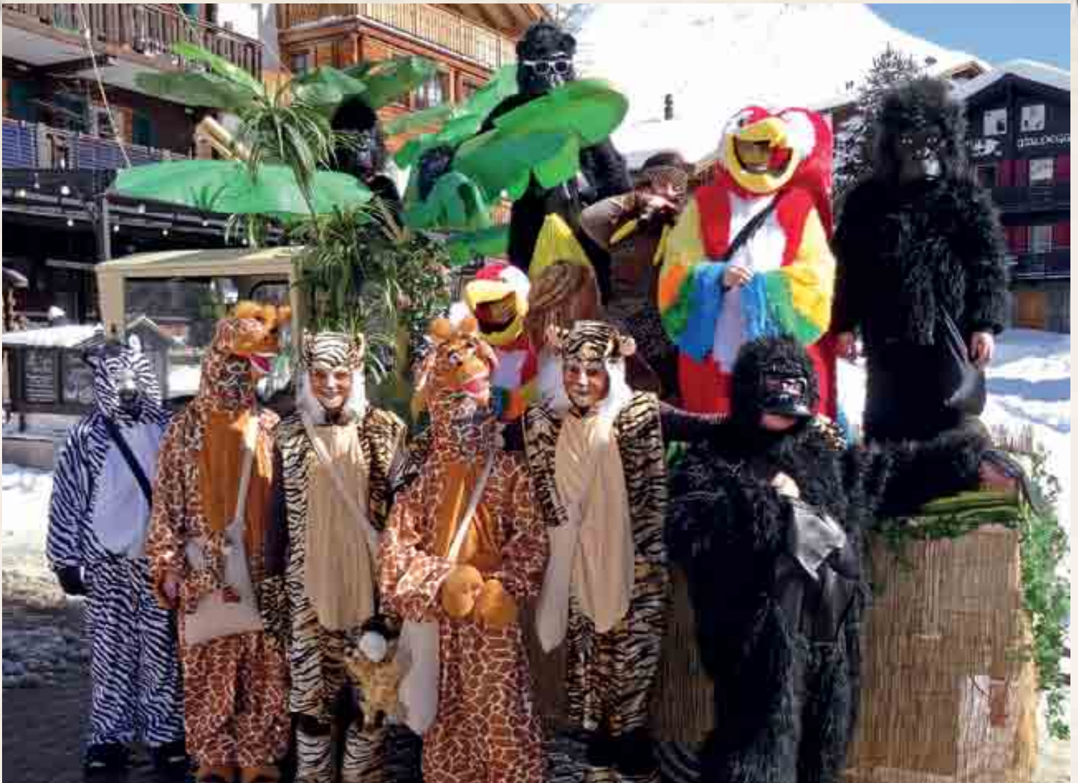
Maschgini, Konfetti, Guggenmusik: In allen vier Saaser Feriendörfern wird die Narrenzeit ausgiebig gefeiert. Dazu gehören auch die traditionellen Fasnachtsumzüge.