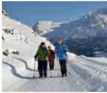
Mit dem Winterwanderpass können Fussgänger alle Bergbahnen im Saastal nutzen.

Der Wanderpass Saastal berechtigt zur Nutzung aller Bergbahnen im Saastal und ist für 6 bzw. 4 aufeinanderfolgende Tage gültig. Mit dem Saaspass ist der Winterwanderpass für 6 Tage für Fr. 117.– (Kinder Fr. 94.–) erhältlich, 4 Tage kosten Fr. 90.– (Kinder Fr. 72.–).