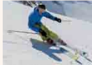
Mit dem Saaspass günstiger Skifahren.

Mit dem Bürgerpass fahren Feriengäste im Winter 2014/15 mit dem Postauto im gesamten Saastal kostenlos und profitieren von vielen Attraktionen zum Vorzugspreis.