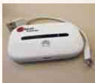
Diese WiFi-Geräte stehen in den Tourismusbüros zum Mieten bereit.

Ab diesem Winter bietet die Freie Ferienrepublik Saas-Fee ihren Gästen wiederum die Möglichkeit, ein WiFi-Gerät, über welches bis zu 10 Smartphones oder Tablets verbunden werden kann, zu mieten. Die Geräte der Firma iSpot sind in den Tourismusbüros in Saas-Fee, Saas-Grund und Saas-Almagell verfügbar. Die Miete kostet für eine Woche Fr. 69.–, zwei Wochen Fr. 119.–, drei Wochen Fr. 158.– und vier Wochen Fr. 189.–. Die Depotgebühr beträgt Fr. 150.–. Es können keine einzelnen Tage gelöst werden.