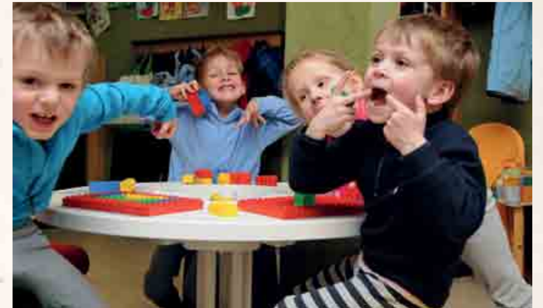
Bei den Kids Days gehts lustig zu und her.

Montag, 30. März 2015, um 16.30 Uhr Ostereier malen im Musikzimmer der Gemeinde Saas-Fee Teilnahmekosten: Fr. 5.-