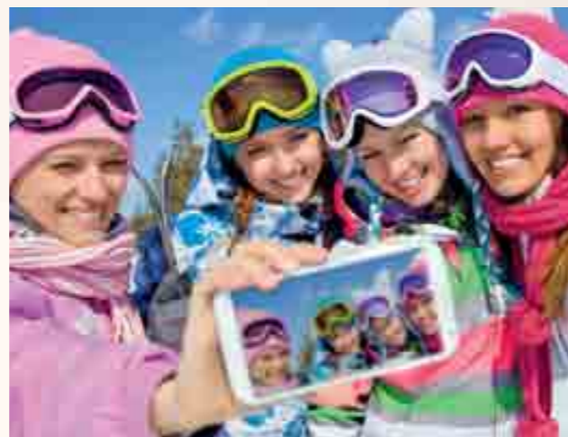
Neu können Wintersportler in Saas-Fee auch auf der Piste online sein.