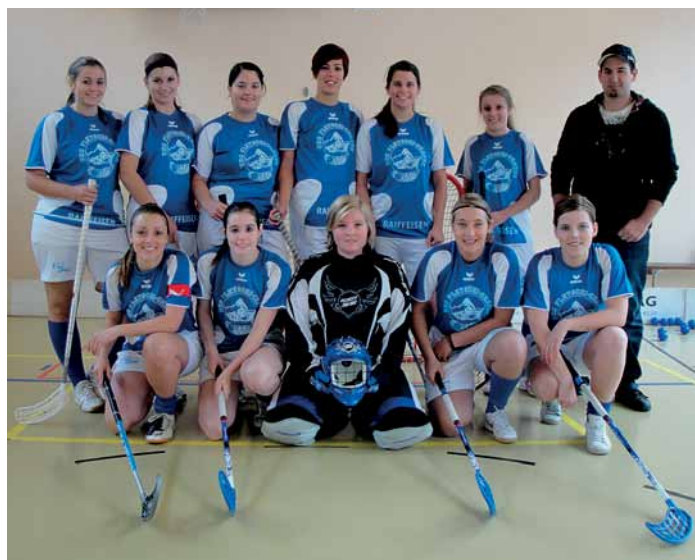
Überraschungs-Meister: die Damen UHC Fletschi Cracks.

Im Cup erreichten die von Ivan Zurbriggen und Martin Anthamatten trainierten Herren überraschend das Finale. Dabei hatten sie zwei A-Vertreter aus dem Wettbewerb delegiert. Am 16. April 2011 spielten sie in Naters gegen den UHC Embd. In einer ausgeglichenen Partie gelang den Saasern die Sensation: Als Unterklassierte gewannen sie gegen den A-Vertreter mit 6 : 4. Den Cupsieg holte sich bis