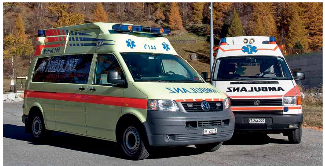
Stehen 24 Stunden für den Notfall bereit: die zwei modern ausgerüsteten Einsatzwagen, die speziell für das Berggebiet konzipiert wurden.

Um Ihren Rettungsdienst näher kennen zu lernen, ist das Team der Ambulanz Saastal jederzeit gerne bereit, Firmen, Vereinen und anderen interessierten Gruppen ihre tägliche Arbeit durch eine Firmenführung und Präsentation näher zu bringen. Gerne steht die Ambulanz Saastal für weitere Auskünfte jederzeit zur Verfügung.