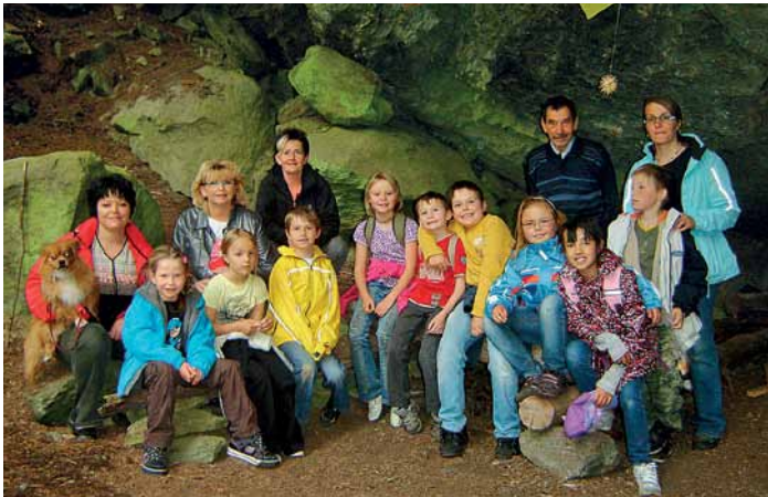
Schule einmal anders: Die Primarschüler bei der Lern- und Erfahrungsexkursion unter dem grossen Stein im Brunnwald.

Am 7. Juni 2011 absolvierten die Schulkinder der Primarschule eine Lern- und Erfahrungsexkursion zum Thema «Unser Dorf».