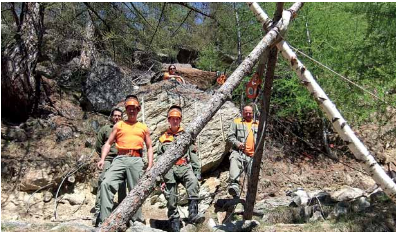
Knacknuss Stützmauer beim Suonenweg Saas-Almagell: Hier war Ideenreichtum gefragt. Die Pioniere erstellten ein Dreibein aus abgesägten Bäumen. An der rund 4 Meter hohen Konstruktion befestigten sie einen Habegger. Mit einem starken Drahtseil zogen sie die schweren Felsbrocken an die gewünschte Stelle.