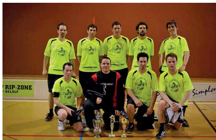
Sensation mit dem Cupsieg geschafft: die Herren UHC Fletschi Cracks.