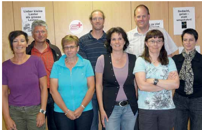
Der neue Vorstand mit Vertretern des Oberwalliser Samariterverbandes.

Mit der Fusion zum neuen Verein Saastal erhofft man sich, personelle Ressourcen besser auszunutzen und den Verein in der ganzen Talschaft stärker zu ver-