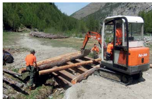
Beim Wanderweg und der Langlauf-Loipe wurden insgesamt vier Brücken saniert.