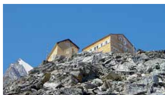
Die Mischabelhütte bietet Unterkunftsmöglichkeiten für bis zu 130 Gäste.