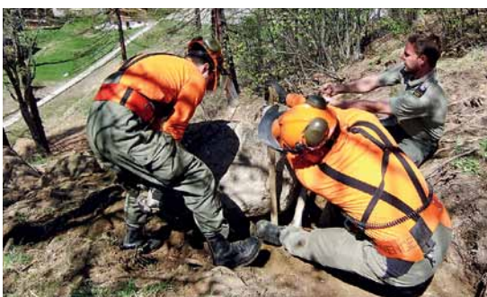
Hangrutsch Saas-Almagell: Pioniere lösen einen Felsbrocken.