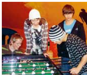
Der Sieg beim «Töggele»-Turnier war hart umkämpft.

selber einbringen. Gutes Essen und Trinken und ein cooles Programm sollen dazu beitragen, dass möglichst viele Jugendliche vor den grossen Prüfungen noch einmal kurz abschalten und ein paar gemütliche Stunden verbringen können. Wir verdanken weitere Sponsoren: Helvetia Patria Jeunesse und La Loterie de la Suisse Romande.