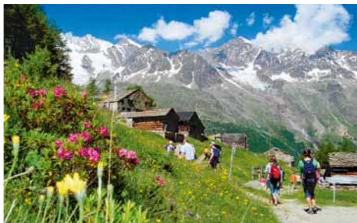
Die Aussicht von der Triftalp ist überwältigend.

Die Triftalp ist einzigartig. Die Ansammlung der historischen Alphütten beeindruckend. Die betriebene Alpwirtschaft zeigt an diesem einmaligen Ort viel auf über das Leben von früher: Traditionen, Heilige Wasser, Landwirtschaft, das harte Leben von früher, den Bezug zur Natur, die Herstellung von Käse. Doch all dies ist gefährdet.