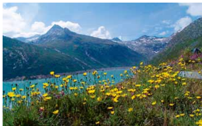
Beim Rundweg um den Mattmark werden fünf Steinbänke installiert.

Die Kosten tragen in erster Linie die Eltern. Zurzeit werden pro Tag und Kind 17 Franken berechnet. Neu möchte man einen einkommensabhängigen Beitrag erheben. Die Gemeinde müsste dann die Differenz zwischen dem tiefsten Beitrag und dem minimalen Ansatz von 17 Franken übernehmen. Die Gemeinde Saas-Fee wird eine Leistungsvereinbarung erstellen und diese den Gemeinden zustellen.