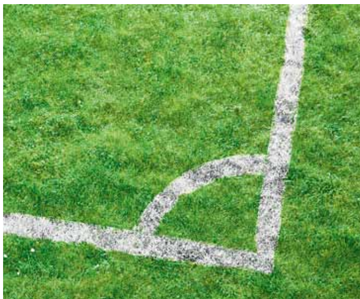
Für die japanische Fussball-Nationalmannschaft wird Rollrasen verlegt.

Die Japaner sind kluge Köpfe. Deshalb erstaunt es nicht, dass sie Saas-Fee als Ort ihres Trainingscamps vor der Fussball-WM in Südafrika ausgewählt haben.