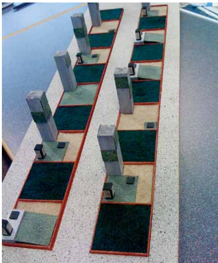
Eine Beton-Stele mit Inschrifttafeln aus Bruchstein vereint zwei Gestaltungselemente zu einem Ganzen.

gangsbereich des Gemeindehauses in Saas-Fee ausgestellt und können dort besichtigt werden.