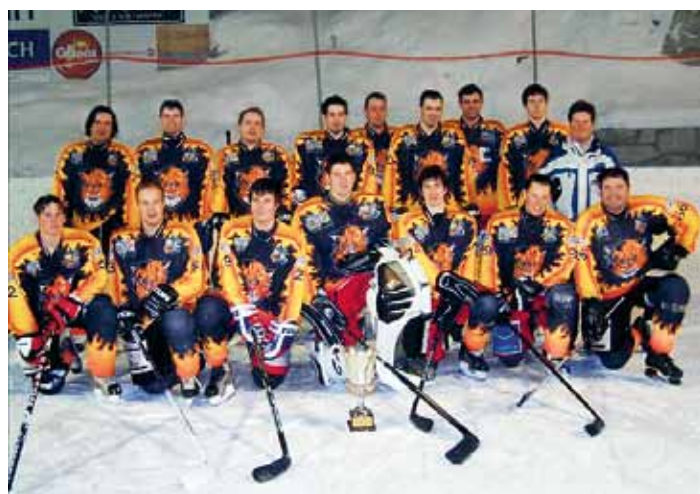
Der EHC Balmertiger holte sich den Pokal zum dritten Mal.

Die Gemeindeverwaltung und die Bevölkerung gratulieren zum Meistertitel und wünschen dem Verein alles Gute für die Zukunft.