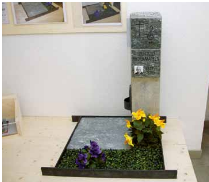
Die Urnengräber können je nach Wunsch mit Bruchsteinplatten als Ganz- oder Teilgrababdeckung erstellt werden.

Die Gedenktafeln für das allgemeine Urnengrab, für Carl Zuckmayer und das Bergführerdenkmal werden an die Friedhofsmauer verlegt. Die neueren Erdgräber im unteren Teil des Friedhofs werden mit Steinumrandungen versehen und die Fusswege mit Steinplatten belegt. Die Steine, die im oberen Friedhofareal verwendet wurden, gibt es nicht mehr. Es wurde aber ein ähnlicher Stein gefunden, mit dem der neuere Teil einheitlich gestaltet werden kann. Die erste Etappe der Friedhofsanierung beginnt am