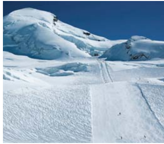
Top-Schneeverhältnisse lockten 2007/08 mehr Gäste auf die Pisten.

Die Bergbahnen Saas-Fee AG blicken auf ein Rekordjahr zurück. Der Umsatz konnte um 8,5 Prozent auf über 29 Millionen Franken gesteigert werden. Der Cashflow stieg gar um 25 Prozent an. Dies erlaubt der Gesellschaft erstmals seit mehreren Jahren wieder die Auszahlung einer Dividende.