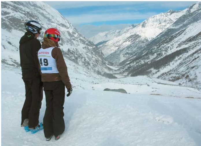
Blick vom Start Richtung Saas-Almagell in die unberührte Winterlandschaft.