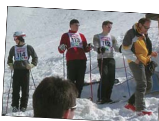
Impressionen des letzten vom SC Weissmies organisierten Talrennens.