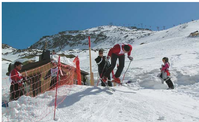
«Auf die Plätze – fertig – los!» heisst es wieder am 22. März 2009.