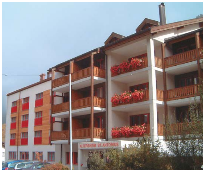
Das vergrösserte Alters- und Pflegeheim hat mit der Stiftergemeinde Eisten einen fünften starken Partner erhalten.

Nachdem am 4. Oktober 2008 das erweiterte Alters- und Pflegeheim feierlich eingeweiht werden konnte, hat man im Saastal erneut Grund zur Freude: Denn anlässlich der letzten Ur- und Burgerversammlung der Gemeinde Eisten wurde die Beteiligung am Alters- und Pflegeheim St. Antonius ohne Gegenstimme angenommen. Damit gelangen nun die aus Eisten stammenden Pensionäre des St. Antonius ebenfalls in den Genuss der Vorzugs-Konditionen der Stiftergemeinde. Und die im Saastal verankerte soziale Institution, die von den Stiftergemeinden Saas-Almagell, Saas-Balen, Saas-Fee und Saas-Grund getragen wird, hat nun mit dem Gewinn des Nachbars Eisten als neue Stiftergemeinde ein zusätzliches starkes Standbein erhalten.