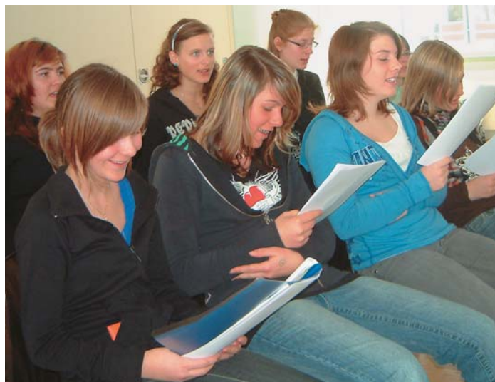
Es wird wieder fleissig geprobt: Insgesamt 13 Lieder gilt es einzustudieren.