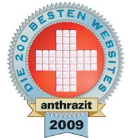
Darf sich mit dem begehrten «anthrazit»-Siegel schmücken: Homepage der Gemeinde Saas-Fee.

Jedes Jahr kürt «anthrazit», das Schweizer Magazin, welches das vernetzte Leben einfacher macht, die 200 besten Websites der Schweiz. 2009 mit dabei: die Website der Gemeinde Saas-Fee.