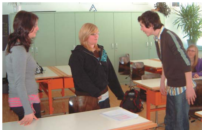
Üben, bis der Text sitzt: Ein Teil des Schauspiel-Ensembles beim Durchgehen einer Textpassage.