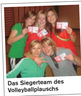
Das Siegerteam des Volleyballplauschs