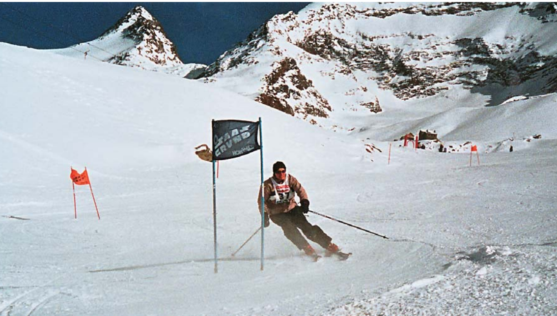
Nach 1999 und 2004 findet das traditionelle Talrennen wieder auf Kreuzboden statt.