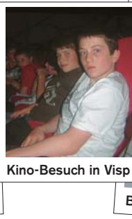
Kino-Besuch in Visp