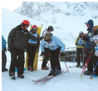
123 Teilnehmer gingen an den Start der legendären Mattmark-Abfahrt.

Am 1. Februar 2009 wurde zum 75-jährigen Bestehen des SC Saas-Almagell die legendäre Mattmark-Abfahrt wieder ins Leben gerufen. Rund 130 Teilnehmer hatten sich für die zuletzt im Jahr 2001 durchgeführte spektakuläre Abfahrt durch unberührte Winterlandschaft angemeldet, wovon 123 an den Start gingen.