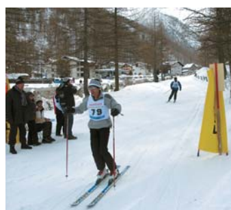
Saas-Almagell, das Ziel der anspruchsvollen Abfahrt.