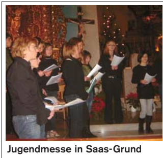
Jugendmesse in Saas-Grund