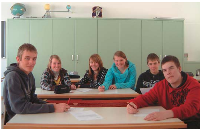
Die Ressortgruppe Medien kümmert sich um die Information der Bevölkerung.

20.00 Uhr in der Turnhalle von Saas-Balen