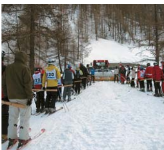
Mit Pistenfahrzeugen erfolgte der Transport zum Start.

tigem Wind am Start liessen sich die Rennfahrer die gute Laune nicht nehmen. Die schnellste Zeit für die knapp 7 km erzielte der Feer Nachwuchsfahrer Jimmy Maurer. Er kam mit sagenhaften 6:21 Minuten ins Ziel. Auch Pfarrer Konrad Rieder war mit am Start und der Erste, der die Ziellinie überfahren durfte. Auch Pirmin Zurbriggen, Olympiasieger und vierfacher Weltmeister, nahm zusammen mit seinen Kindern am Rennen teil und stürmte mit seinem Nachwuchs die Podestplätze.